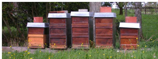
Biohobbyimker durchlaufen eine vereinfachte Kontrolle, sind aber bei der Deklaration stark eingeschränkt